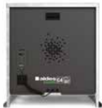
EasyVEC® C4 Micro-watt 5000 à 12000

La gamme de caissons simple-flux la mieux pensée du marché afin de rendre la ventilation performante, sereine et facile.