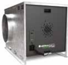
EasyVEC® C4 Micro-watt + 5000 à 12000

La gamme de caissons simple-flux la mieux pensée du marché afin de rendre la ventilation performante, sereine et facile.