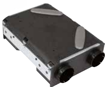
Echangeur By-pass Auto

Solution de ventilation double flux modulaire pour s'adapter à toutes les configurations d'installation possibles.