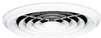
Diffuseur SC 831

Le SC 831 est un diffuseur circulaire concentrique en acier pour la diffusion d'air fixe et un soufflage horizontal.