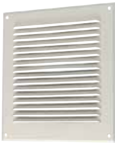
Grille métallique GAT

GAT-GR sont les grilles métalliques d'aération à destination des maisons individuelles et des logements collectifs.