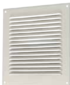
Grille métallique GAT

GAT-GR sont les grilles métalliques d'aération à destination des maisons individuelles et des logements collectifs.