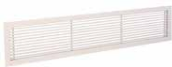
Grille Gridlined wall

La grille murale intérieure fixe en aluminium GRIDLINED Wall est destinée au soufflage et à la reprise de l'air dans les bâtiments tertiaires.