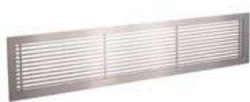
Grille Gridlined wall

La grille murale intérieure fixe en aluminium GRIDLINED Wall est destinée au soufflage et à la reprise de l'air dans les bâtiments tertiaires.