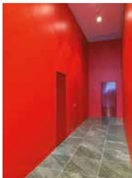
Grille GGH esthétique installée dans un couloir