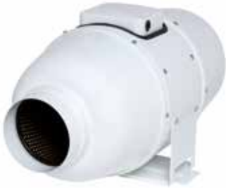
IN LINE XSilent

IN LINE XSilent est un ventilateur de conduit performant et silencieux grâce à son enveloppe acier et son isolation intérieure de 50 mm.