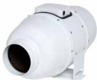
IN LINE XSilent

IN LINE XSilent est un ventilateur de conduit performant et silencieux grâce à son enveloppe acier et son isolation intérieure de 50 mm.