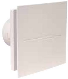
INEA ECO SILENT 100

INEA ECO SILENT est un extracteur permanent à destination de petites ou grandes pièces, qui offre un air libéré d'humidité et d'odeurs 24h/24. Doté d'un moteur EC ultra basse conso et silencieux.