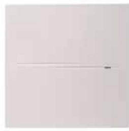
INEA ECO SILENT 100 vue de face