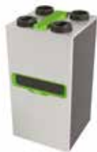
InspirAIR® Top 300 Classic

La solution double flux qui filtre efficacement les polluants les plus fins et s'adapte à vos besoins