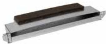
Manchon MTR standard

MTR est le manchon pour une esthétique de façade linéaire.