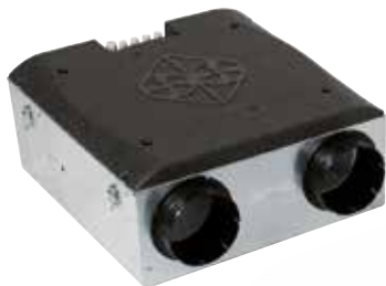
Moto ventilateur HY

Solution de ventilation double flux modulaire pour s'adapter à toutes les configurations d'installation possibles.