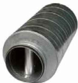
Octa à baffle diamètre 400 à joint

Le piège à son OCTA à Baffle atténue très fortement la propagation acoustique (moyennes et hautes fréquences) dans un réseau circulaire.