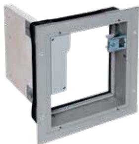
OPTONE «classic» 2H/1V

Les volets de désenfumage OPTONE «Classic» sont destinés aux locaux tertiaires et peuvent être utilisés en amenée d'air comme en extraction de fumées.