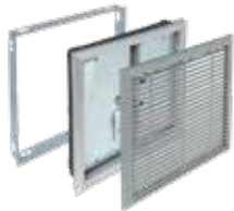
OPTONE «classic» 2H/2V

Les volets de désenfumage OPTONE «Classic» sont destinés aux locaux tertiaires et peuvent être utilisés en aménée d'air comme en extraction de fumées.