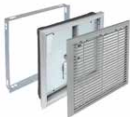
OPTONE «classic» 2H/2V

Les volets de désenfumage OPTONE «Classic» sont destinés aux locaux tertiaires et peuvent être utilisés en amenée d'air comme en extraction de fumées.