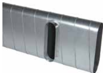
Piquage Droit Oblong sur Plat

Le piquage droit oblong sur plat 90° permet de réaliser un piquage à 90° sur un conduit de type oblong ou rectangulaire galvanisé.