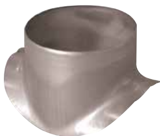
Piquage Equerre Circulaire en aluminium

Le piquage équerre circulaire alu permet de réaliser un piquage à 90° sur un conduit circulaire aluminium.