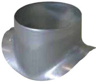
Piquage Equerre Circulaire 90°

Le piquage équerre circulaire permet de réaliser un piquage à 90° sur un conduit circulaire galvanisé.