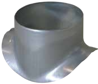
Piquage Equerre Circulaire 90°

Le piquage équerre circulaire permet de réaliser un piquage à 90° sur un conduit circulaire galvanisé.