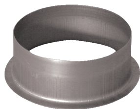
Piquage Equerre sur Plat en aluminium

Le piquage équerre sur plat alu permet de réaliser un piquage à 90° sur un conduit rectangulaire aluminium.