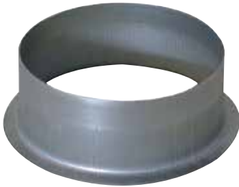
Piquage Equerre sur Plat 90°

Le piquage équerre sur plat permet de réaliser un piquage à 90° sur un conduit de type oblong ou rectangulaire galvanisé.