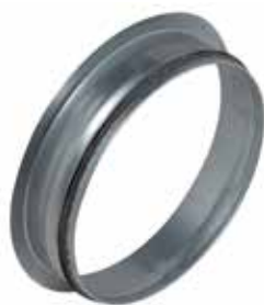
Piquage Equerre sur Plat à joints

Le piquage équerre sur plat à joints permet de réaliser un piquage à 90° sur un conduit de type oblong ou rectangulaire galvanisé.