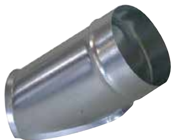
Piquage Oblique Circulaire 45°

Le piquage oblique circulaire permet de réaliser un piquage à 45° sur un conduit circulaire galvanisé.