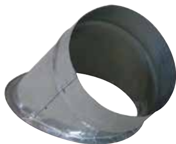
Piquage Oblique sur Plat 45°

Le piquage oblique sur plat permet de réaliser un piquage à 45° sur un conduit de type oblong ou rectangulaire galvanisé.