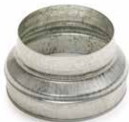
Réduction Conique Concentrique

La RCC permet de raccorder deux conduits galvanisés de diamètres différents entre eux.