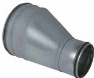
Réduction Conique Excentrée à joints

La RCE à joints permet de raccorder deux conduits galvanisés de diamètres différents entre eux tout en assurant une étanchéité classe C.