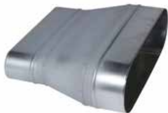
Réduction Concentrique Oblongue

La RCO permet de raccorder deux conduits oblongs de sections différentes.