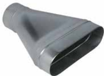
Réduction Concentrique Oblongue Cylindrique

La RCOC permet de raccorder un réseau oblong à un réseau circulaire.