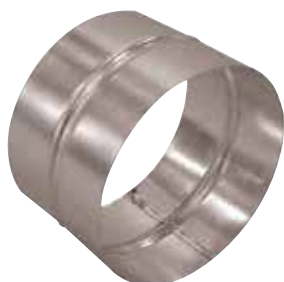
Raccord Femelle en aluminium

Le raccord femelle alu permet de raccorder deux accessoires aluminium entre eux.