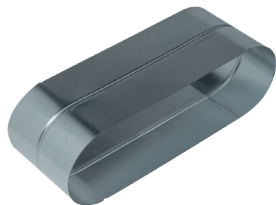
Raccord Femelle Oblong

Le raccord femelle oblong permet de raccorder deux accessoires oblongs entre eux.