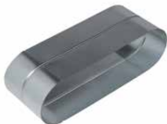
Raccord Femelle Oblong

Le raccord femelle oblong permet de raccorder deux accessoires oblongs entre eux.