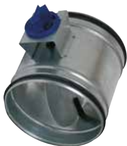
Registre d'Equilibrage Perforé en aluminium

Le registre d'équilibrage alu permet de régler la pression dans des branches de réseaux aérauliques en aluminium en bâtiment tertiaire ou collectif.