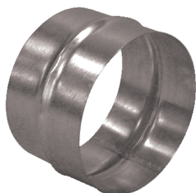
Raccord Mâle en aluminium

Le raccord mâle alu permet de raccorder deux conduits aluminium entre eux.