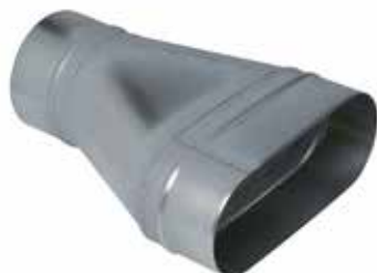
Réduction Oblongue Cylindrique Tangentielle sur Plat

La ROCTP permet de raccorder un réseau oblong à un réseau circulaire tout en conservant un réseau linéaire et plat, sans perte de place vers le bas.