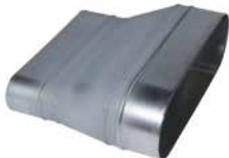
Réduction Oblongue Tangentielle sur Plat

La ROTP permet de raccorder deux conduits oblongs de sections différentes et de conserver un réseau linéaire et plat, sans perte de place vers le bas.