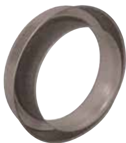
Réduction Plate Concentrique en aluminium

La RPC alu permet de raccorder deux conduits aluminium de diamètres différents entre eux sur un minimum de longueur.