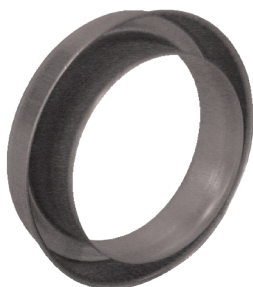
Réduction Plate Concentrique en aluminium

La RPC alu permet de raccorder deux conduits aluminium de diamètres différents entre eux sur un minimum de longueur.