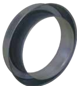
Réduction Plate Concentrique

La RPC permet de raccorder deux conduits galvanisés de diamètres différents entre eux sur un minimum de longueur.