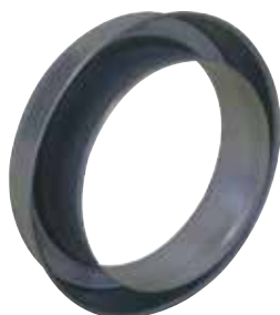
Réduction Plate Concentrique

La RPC permet de raccorder deux conduits galvanisés de diamètres différents entre eux sur un minimum de longueur.