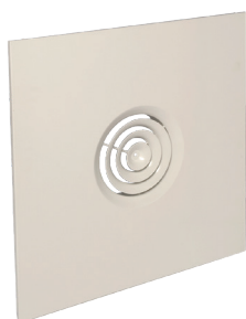
SC 832 TP F0 D200 (AxB=600x600)

Le SC 832 TP est un diffuseur concentrique en acier pour la diffusion d'air fixe et soufflage horizontal, conçu pour remplacer une dalle de plafond standard.