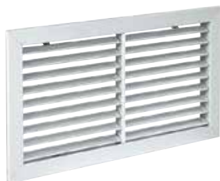
Grille SC 121

La grille murale SC 121 en acier permet la reprise d'air dans un local pour des installations de ventilation ou de conditionnement d'air.