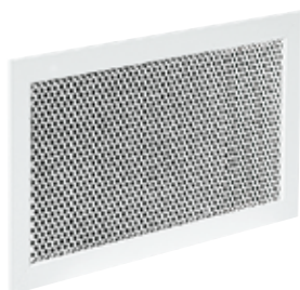
Grille SC 125

La grille murale perforée SC 125 assure la reprise d'air dans les installations de ventilation et de climatisation avec une esthétique discrète.