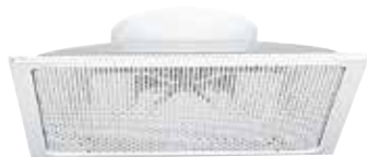
SC319R F16 D200 400x400

Le SC 319 R est un diffuseur carré à tôle perforée pour la reprise d'air.