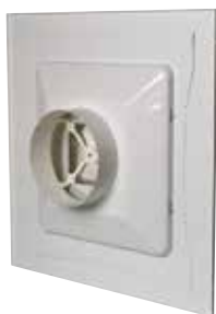
Diffuseur SC 369R

Le SC 369 R est un diffuseur carré à tôle perforée pour la reprise d'air.