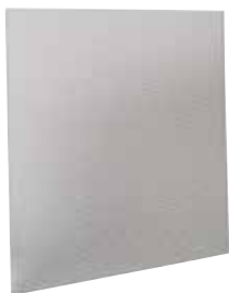
Grille de reprise SC 370

La grille pour dalle de plafond SC 370 assure la reprise d'air dans les installations de ventilation et de climatisation avec une esthétique discrète.