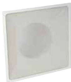
SC370 F0 598x598

La grille pour dalle de plafond SC 370 assure la reprise d'air dans les installations de ventilation et de climatisation avec une esthétique discrète.